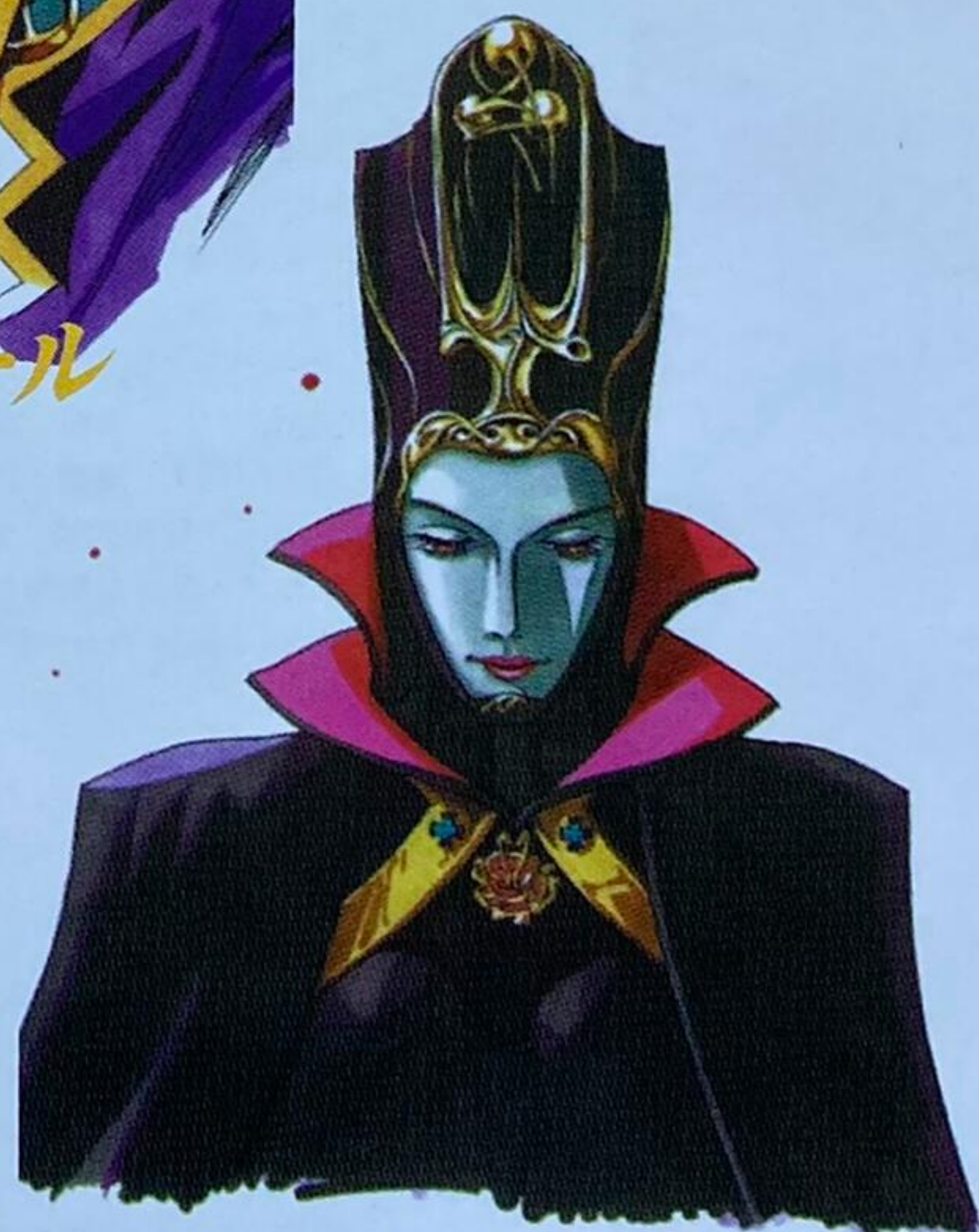
シャドウクイーン